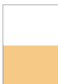
1/2 página: 20,20cm x 13,10cm

Anunciantes, agências de propaganda e veículos de comunicação criaram as Normas-Padrão da Atividade Publicitária para disciplinar suas relações profissionais, comerciais e concorrenciais. E formaram o CENP para cobrar profissionalismo, desenvolvimento técnico e, principalmente, compromisso com a ética. O CENP assemelha-se ao CONAR, outro instrumento de autorregulamentação da atividade. E suas Normas-Padrão devem ser espontaneamente obedecidas, para o bem de todos. Filiar-se ao CENP é garantir que, acima de qualquer transformação pela qual possa passar o mercado, a saúde do negócio seja mantida e progreda dentro de interesses comuns. O mercado só vai aceitar as agências de propaganda que respeitarem as Normas-Padrão. A Editora CARAS não se responsabiliza pelo conteúdo dos anúncios publicados. Quaisquer despesas originadas por eventuais autuações serão repassadas ao anunciante.