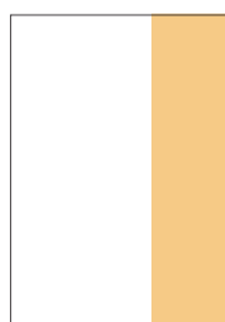
1/3 página: 6,70cm x 26,60cm